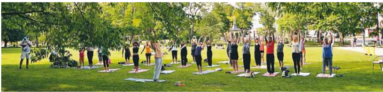
Närmare 30 deltagare, på varierande nivåer, njöt av yoga i parken.

TOMMY PETTERSSON tommy.pettersson@linkopingsposten.se